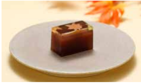
秋の棹菓子「いろどり(紅葉)」。