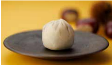
蜜漬けした大粒の栗を粒餡とこなし餡で包んだ「栗まる」。