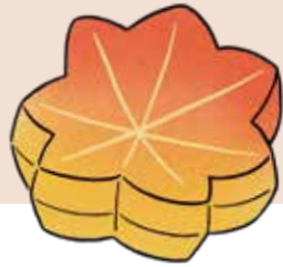
illustration 小幡彩貴 菓子 / 「竜田」 鶴屋吉信

現代では、料理名でも直接的なものが増えている印象がありますが、吹き寄せ揚げ、みぞれ椀、時雨煮など、風情のある名前が多く残っているのも事実です。料理名や菓子名から季節を感じ取り、耳で楽しむことも、食の一部であるといえます。言葉を大切にしてきた日本人ならではの、耳から感じる季節感を、これからも大切にしていきたいですね。