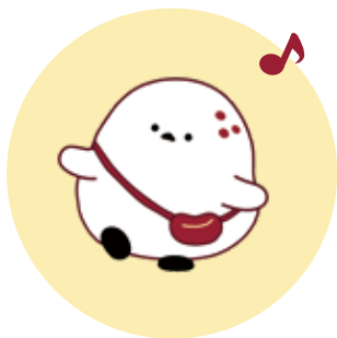
図7 シマエ大福 北海道「全国菓子大博覧会」 公式キャラクター