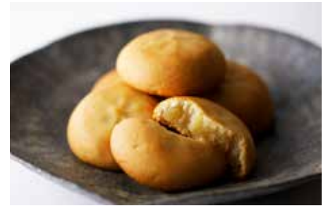
余情乳菓 どんつくつ／金沢 うら田

〒500-8009 岐阜県岐阜市湊町42 ☎ 0120-601-276 ●https://tamaiya-honpo.co