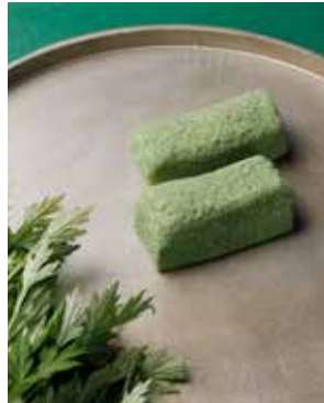
「よもぎ若草」。代表銘菓の「若草」をさらに磨き上げた逸品。2024年9月から販売開始。