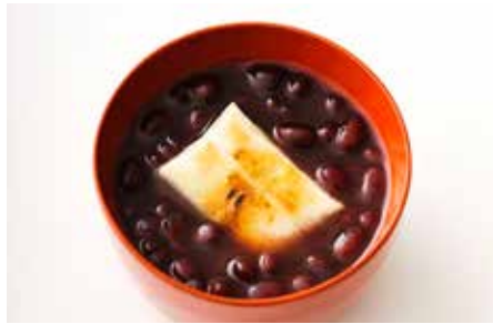
榮太樓ぜんざい 餅入り／榮太樓總本舗