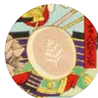
杉形まんぢう太 (松葉焼饅頭)

【お問い合わせ】 TEL：03-3408-2402 FAX：03-3408-4561 MAIL：bunko@toraya-group.co.jp https://www.toraya-group.co.jp/corporate/bunko/