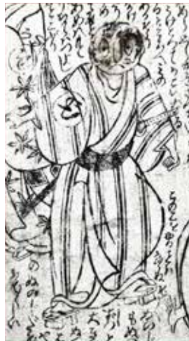
図2 どらやきまる介 『風流上下の番附』(1776)より 東京都立中央図書館特別文庫室蔵