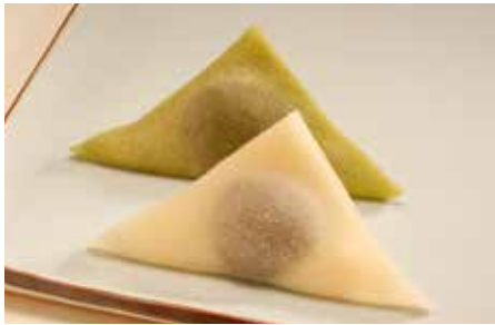
つぶあん入り生ハッ橋「聖」／聖護院ハッ橋総本店

〒683-0812 鳥取県米子市角盤町3-100 ☎ 0859-32-3277 ●http://tsurudaya.jp