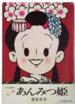
図5『あんみつ姫』 二見書房・サラ文庫版（1976） の表紙