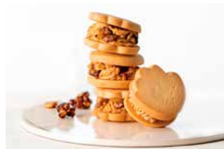
祝うてサンド／石村萬盛堂

商品をイメージアップする 株式会社 川島製作所 埼玉県草加市谷塚上町4-34 ☎ 0489-27-7111 (本社営業部)