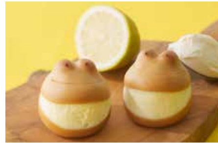
ケロトツォククリームチーズ&レモン／青柳総本家

〒604-8092 京都市中京区姉小路通御幸町西入ル ☎ 0120-221-497 ●http://www.kawamichiya.co.jp