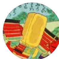
かすていら玉子太 (カステラ)