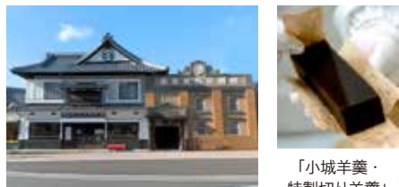
「小城羊羹・ 特製切り羊羹」

「村岡総本舗 羊羹資料館」開館40周年 羊羹の歴史や製法を学び、伝統製法の羊羹が味わえる、和菓子党垂涎の「村岡総本舗 羊羹資料館」が開館40周年を迎えました。1941年築の砂糖蔵を改装した建物は国の有形登録文化財。12月に「羊羹のおいしさ講座」を開催予定。