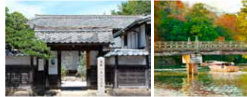
▶明々庵。松江城を借景にした不昧公好みの茶室。併設の座敷でお茶と和菓子が楽しめる。