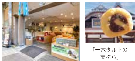
「一六タルトの 天ぶら」

道後本館前店がリニューアル。工房を新設し、「一六タルトの天ぶら」や「SHIRASAGIパフェ」、「ICHIROKU(16)ソフト」などの食べ歩きスイーツの販売を始めました。2階のイートインの窓からは、道後温泉本館が目の前に広がります。