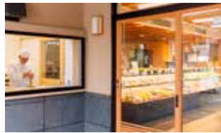
彩雲堂本店。入口脇に菓子を作る職人が見える窓があり、思わず見入ってしまう。2階には居心地のよい茶寮がある。

気軽な茶の湯を世界に 「最近、タイで茶の湯を楽しんでいただくイベントをしてきました。向かい合わせに座って、お茶を点て、相手に飲んでもらう。それだけなのですが、お茶碗を交換した途端に笑顔が広がる。見知らぬ人同士が仲良くなる。お茶の持つ大きな力を感じて、気軽な松江の茶の湯を世界に広めていかなければと、勝手に使命感に燃えています(笑)」 ——社長を継がれたのは何歳の時でしたか？ 「43歳でした。のんびりした性格で、集団行動も得意ではないタイプですので、それまでは行政とのお付き合いもありなかつたのですが、その年の不昧公没後二百年祭に向けて一緒に活動するうちに、ご縁が広がり、意識が変わっ ていきました。社長になると景色が変わって見えるよ、と人から聞いてはいましたが、本当にそのとおりでした」 ——社長として、何を大切にされていますか？ 「決断の一つひとつを、損得ではなく善悪を基準に考えるようになりました。商売ですから利益は大切ですが、最後は社会にとって善かれと思える方向を選んでいきます。 創業150年を記念して、この春、工場の敷地を開放して工場まつりを催したのですが、そこで本当に多くの方に支えられて今があることを実感しました。そして愛される会社であり続けられるように、時代に合った菓子を提案できる会社にしていこうと決心しました。 のんびり屋なりに、攻めに転じていこうと思っています(丁)