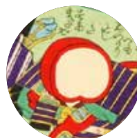
すあまノ十郎へり取 (すあま)