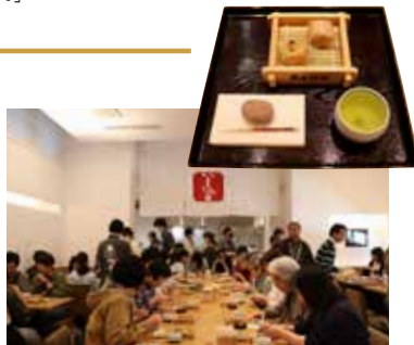
1974年から続く柏屋の「朝茶会」