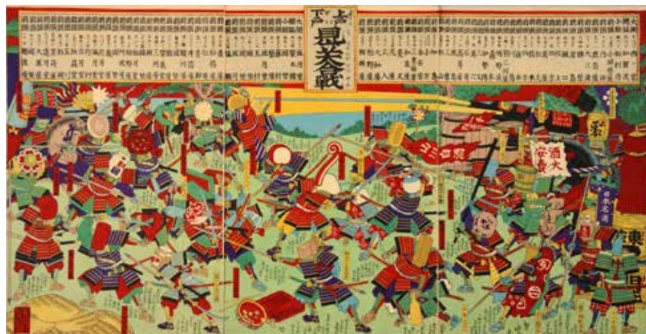
図4 歌川春暁「上戸と下戸見立大合戦」(1892) 吉田コレクション