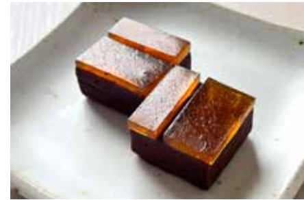
乃し梅子ヨコ玉響／乃し梅本舗 佐藤屋