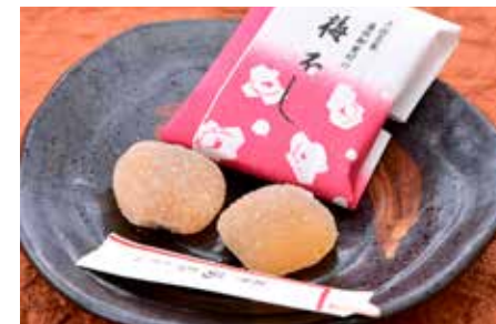
うめびし 梅不し／西川屋老舗

丸芳露本舗 北島 ●丸芳露 〒840-0826 佐賀県佐賀市白山2-2-5 ☎ 0120-26-4161 ●https://shop.marubolo.com