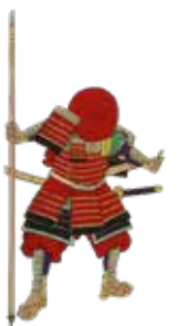
最中ノあん太八重成 「上戸と下戸見立大合戦」 (1892)より

和菓子キャラクターと聞いて真っ先に思い出すのは、顔があんぱんの「アンパンマン」でしょうか。正義の味方、スーパーヒーローがあんぱんとは実にユニーク。同作品にはヨカンマダムやあめぼうや（金太郎飴）ほかも登場しますので、甘いもの好きにはたまりません。菓子を人間に見立てて描くという発想が楽しいですが、意外にもこうした擬人化はすでに江戸時代の黄表紙（漫画）や錦絵にも見られるもの。今回は和菓子キャラクターを追ってみましょう。