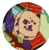
うす皮金つば (金つば)