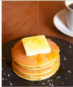
「ホットケーキ風 どら焼き」