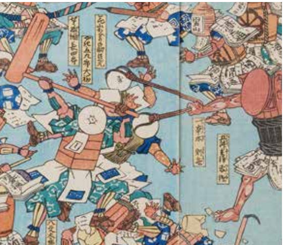
図3 「八文太郎腹太」(腹太餅)と「やき立九郎大福」(大福) 歌川広重「太平喜餅酒多多買」(1843〜46)より 虎屋文庫蔵